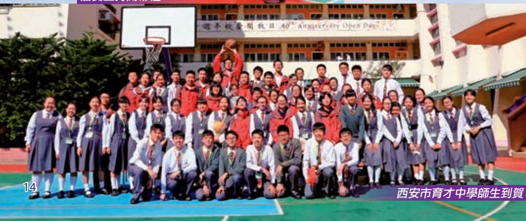
西安市育才中學師生到賀