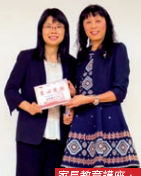
家長教育講座， 讓家長認識正向教育

聖經告訴我們：「因為你們是重價買來的。所以，要在你們的身子上榮耀神。」（林前六20）人生要面對不可預期的逆境，正向教育不是抗逆的靈丹妙藥，克服逆境也在乎倚靠神，為此，在推行正向教育的同時，本校亦不會忘記把孩子帶到神面前，讓孩子認識神，一生與神同行。