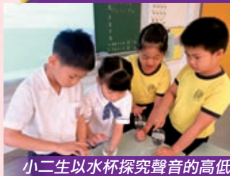
小二生以水杯探究聲音的高低