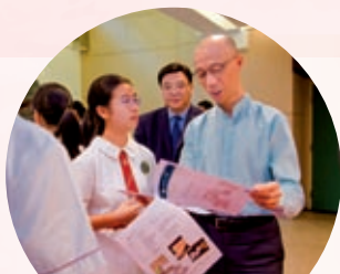
同學向黃錦星局長分享拒用垃圾桶一星期的體驗