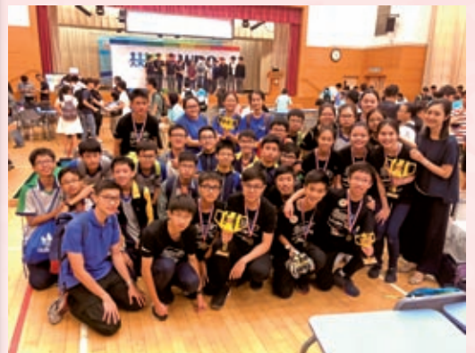
機械人隊比賽後合照