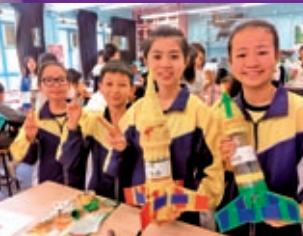
於製作水火箭過程中培養同學解難能力