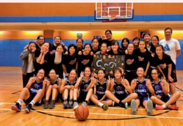
女籃高昂的團隊精神