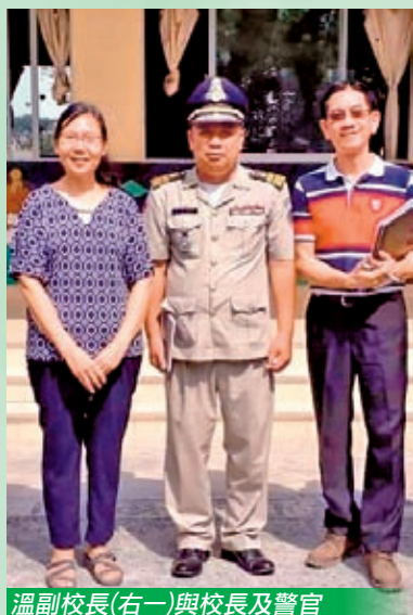
溫副校長(右一)與校長及警官