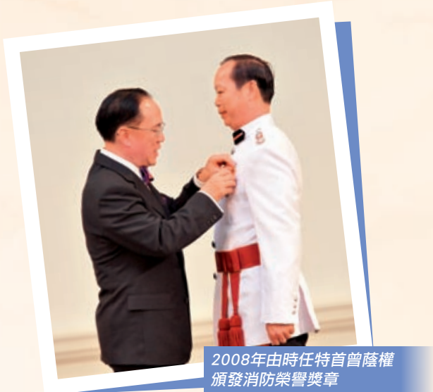
2008年由時任特首曾蔭權 頒發消防榮譽獎章

已經較舊時改進了很多，困難和危險仍是不能避免的。其中他提到最危險的是火場裡氣體洩漏，不過岑校董就堅定地說他們不能退避，即使這項工作具有高度危險性。工作上他會專業處理，剩下的就會交給神。他每天早晨都會向神祈禱，將一日的工作交給神，在禱告中獲得從神而來的平安去面對工作上的困難。