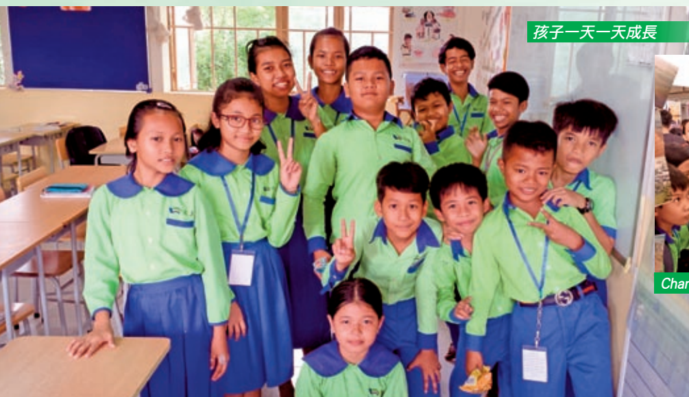
孩子一天一天成長