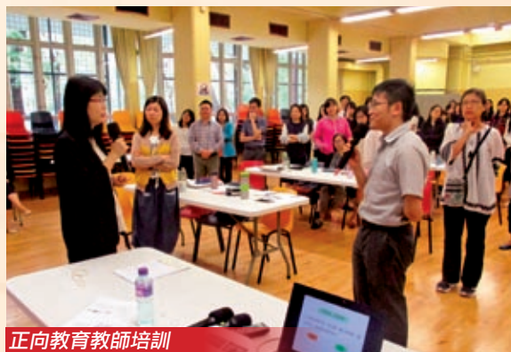
正向教育教師培訓

若要培育學生自主學習的精神，在學習的早期前備階段便要引導學生養成良好生活作息、時間管理，以至情緒及壓力控制等；因此本校訓輔組本年度以「正向成長，各展所長」為主題，推動本校的正向教育發展。正向教育著重全人發展，培育學生在六大範疇（身心健康、正向情緒、全心投入、正向關係、意義人生、成就感）的成長。正向教育又以發展個人品格強項為另一重點，讓學生發揮個人所長，建立快樂感和幸福感。