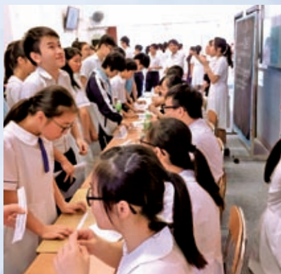
Students crowding around the One-Minute-Presentation Counter to earn scores for their houses on English Speaking Wednesday

讀萬卷書不如行萬里路，是次親身考察大灣區「9+2」個城市之一的珠海，除了可以了解其發展理念與前景，更能感受到它的年輕活力。珠海鼓勵創意產業的發展，特別規劃了「橫琴創意谷」、「樂土文化區」等發展項目，提供租金優惠予年青人進駐，當中涵蓋的產業從高端手機智能程序，到木雕手作，無所不有，顯示了大灣區多方面的發展潛力。