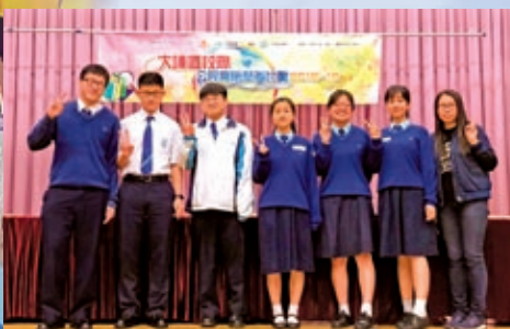
大埔區公民及時事常識問答比賽榮獲季軍