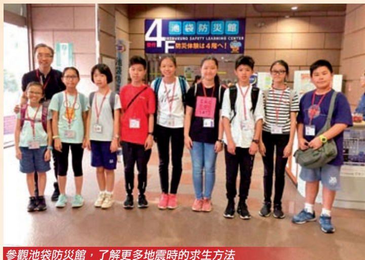
參觀池袋防災館，了解更多地震時的求生方法

公益少年團以「認識、關懷、服務」的口號和宗旨，與本校理念一致，故過往一直推動學生積極參與，本校學生更連續七年獲選為沙田區傑出團員，有機會代表香港參加境外交流活動。以下是應屆畢業生的交流心得節錄：