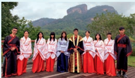
師生穿著傳統漢服進行敬師禮（閩港中小學夏令營）