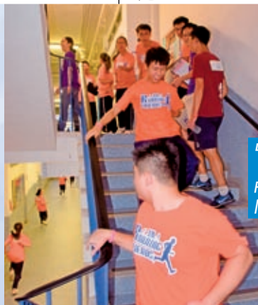
中四級活動「主恩 Running Friends」展現同學團隊精神