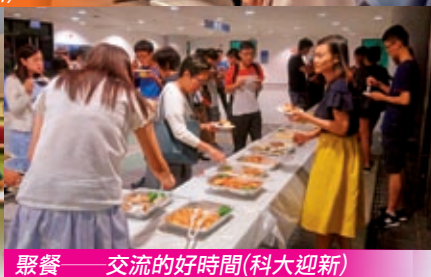
聚餐——交流的好時間(科大迎新)