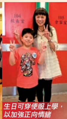
生日可穿便服上學， 以加強正向情緒

聖經告訴我們：「因為你們是重價買來的。所以，要在你們的身子上榮耀神。」（林前六20）人生要面對不可預期的逆境，正向教育不是抗逆的靈丹妙藥，克服逆境也在乎倚靠神，為此，在推行正向教育的同時，本校亦不會忘記把孩子帶到神面前，讓孩子認識神，一生與神同行。