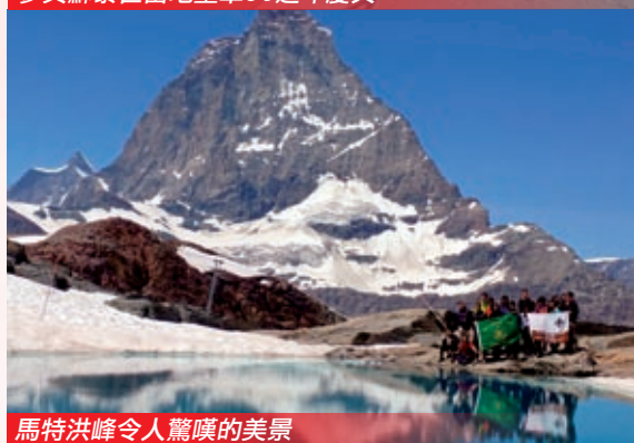
馬特洪峰令人驚嘆的美景