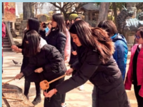
於太宰府學習日本的禮儀文化

唐朝時，日本不少遣唐大使從福岡出發，來唐學習漢唐文化，並帶回大量唐玄宗送贈的珍寶。在平安時代中期，福岡成為南宋和日本貿易的主要據點。近年，福岡成了日本旅遊勝地，同時保留了許多與中國歷代皇朝交流的足跡。學校獲百仁基金贊助，通識科和中國歷史科於2018年2月籌辦了是次考察團，帶領二十多名學生到福岡考察，讓學生透過小組導賞，了解歷朝中日關係的發展。