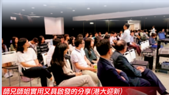
師兄師姐實用又具啟發的分享(港大迎新)