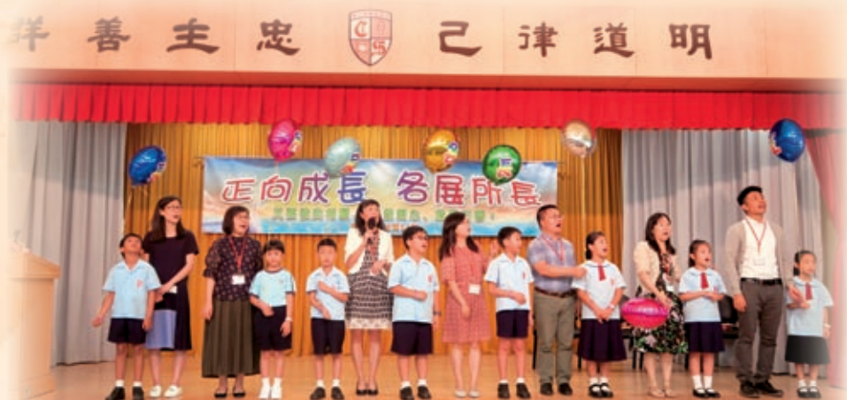
開學禮，學生將本年主題放飛天際