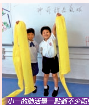
小一的肺活量一點都不少呢！

學生透過參與STEAM各項科學及科技探究活動，獲得寶貴經驗，培養出對科學的興趣及探究精神。除了日常課堂內的科學活動外，學生亦會參與「迦密小小電子工程師計劃」及STEAM專題式的「科學實驗室」活動。此外，我們讓學生進行產品設計，並連結於服務學習，深化對服務對象的關懷行動。