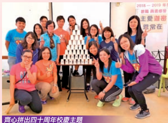
齊心拼出四十周年校慶主題