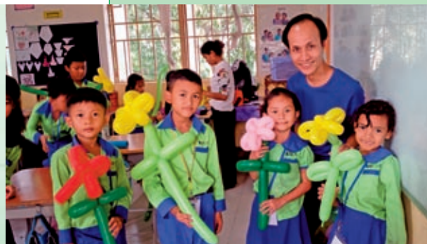
宣教士Hero哥哥教扭扭球

學校由九月開始至今，缺乏兩位中文科老師，我們心裡著急，感激多位香港宣教士來支援，使學生都能上課。感謝神，我們KIS大家庭將會多兩位成員。這兩位中文科老師將於2019年2月來學校任教。她們從未踏足過柬埔寨，憑著信心開始她們的新生活，求神與她們同在，讓她們早日適應異地的文化。