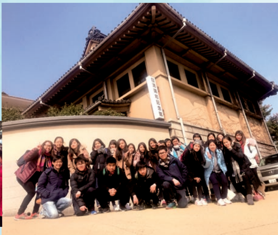
於中日日清講和紀念館前留影，了解甲午戰爭的結果及影響