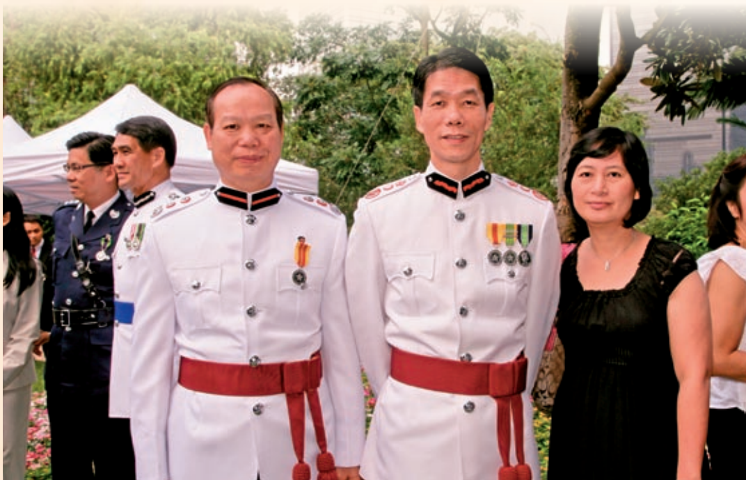
2008年獲特區政府 頒發消防榮譽獎章— 與太太及消防處處長 盧振雄先生合照