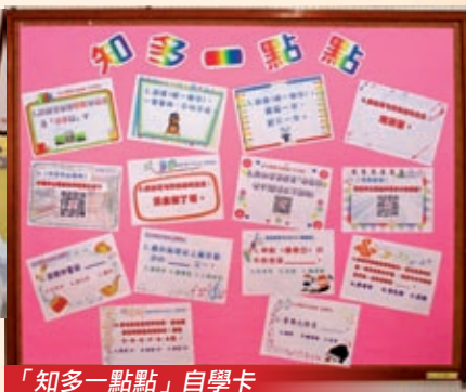
「知多一點點」自學卡