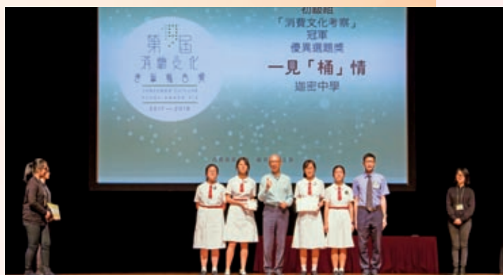
一見「桶」情——我們各人在不知不覺間都跟垃圾桶有一段難捨的情

透過參加第十九屆消費文化考察報告獎，我們瞭解到垃圾桶、垃圾和消費者的關係。透過實驗，我們在一星期裏，不扔垃圾，真實地感受這三者的影響。我們日常消費，製造大量垃圾；因此我們要改變消費習慣，減少購買多層包裝產品和樽裝飲品。現在政府關注環保，市民應該實行個人的「少垃圾計劃」，例如在超市購物，自備環保袋；改變消費習慣，拯救地球。