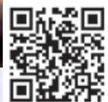
感恩崇拜 師生合唱

「良柏青青 恩雨盈盈」。此曲由本校同學創作，藉音樂讚頌神豐富的恩典。歌詞把學校比喻為一個充滿愛的大家庭，師生校友情繫遍四方。