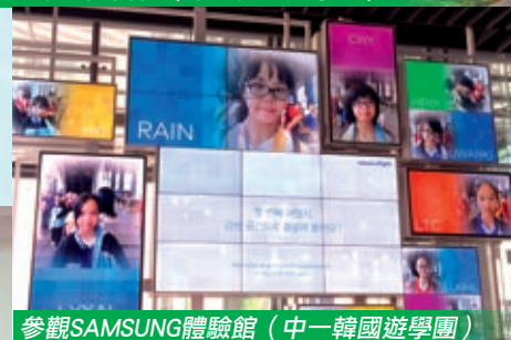
參觀SAMSUNG體驗館（中一韓國遊學團）