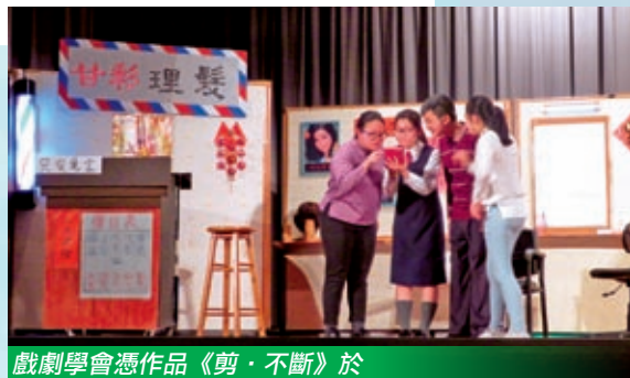
戲劇學會憑作品《剪·不斷》於香港學校戲劇節取得14個獎項