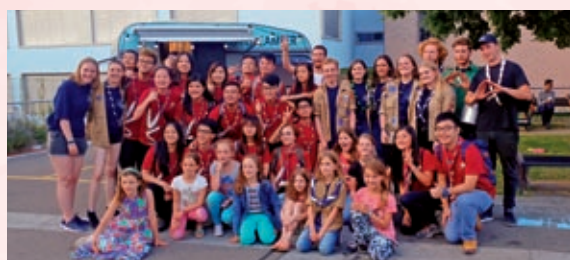
參與蘇黎世當地童軍90週年慶典

基於「不怕失敗，努力嘗試」的信念，深資童軍撰寫計劃書，討論未來領袖的發展方向，結果脫穎而出，獲民政事務署贊助，於2018年初夏舉辦了瑞士交流之旅，衝出亞洲，到訪了蘇黎世、策馬特、伯恩，與當地國際童軍中心交流。在這次旅程中，我們有機會與當地的中學生交流，了解到兩地的學制、課程與中學生活的差異；此外，我們又到過不少地方參觀，例如觀賞過壯麗的阿爾卑斯山、廣闊無垠的青綠草原、上過馬特洪峰，看著屬於我們的旅團旗幟在峰頂上迎向陽光，這一切都叫我們十分興奮，亦深刻地體驗到大自然的力量；再者，我們亦參與各樣活動，如攀石，使我們踏出安舒區，有所突破。Go The Extra Mile 讓我們擴闊了眼界；只要我們肯踏出第一步，在未知成敗之前，先盡力嘗試，我們會有十分豐富的收穫。