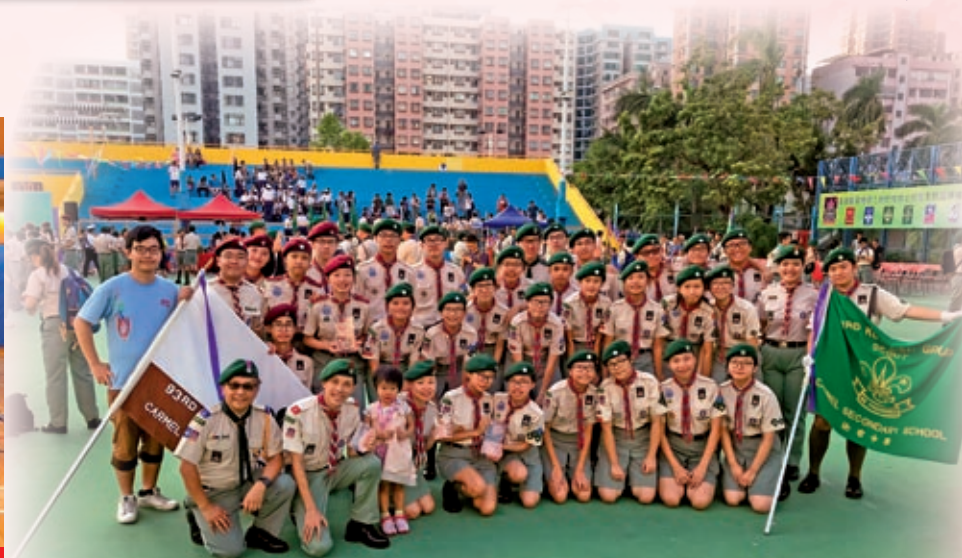
童軍榮獲傑出旅團金獎2018