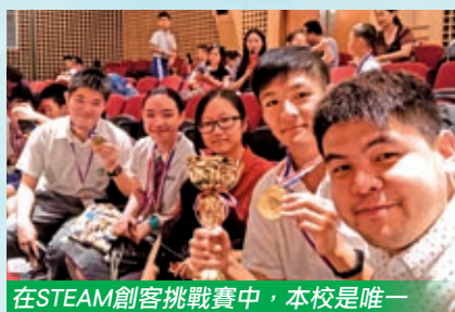
在STEAM創客挑戰賽中，本校是唯一獲得初中組一等獎的香港區中學