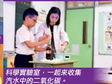
科學實驗室，一起來收集汽水中的二氧化碳。