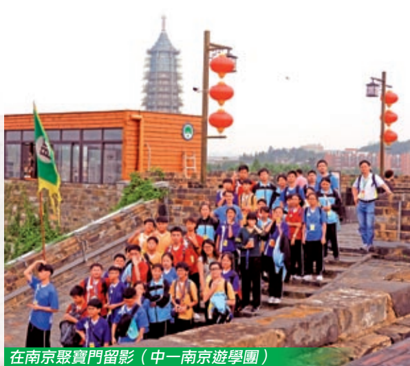
在南京聚寶門留影（中一南京遊學團）

除了校本的遊學團（例如中一遊學團）外，學校亦參與不同機構舉辦的境外學習活動，例如與宣教會恩耀堂合作的柬埔寨服務交流團、中國科學技術協會及國家教育部主辦的「高校科學營2018」——優秀高中生獎勵計劃、中國星火基金會主辦的「星火愛心大使」連山義教團、東莞市港澳事務局及東莞市教育局主辦的「莞香傳情」莞港澳青少年成長營、福建省教育廳主辦的閩港中小學夏令營等，透過參觀、文化交流及體驗、義工服務、團隊訓練等，拓闊學生視野，豐富他們各種學習經歷。