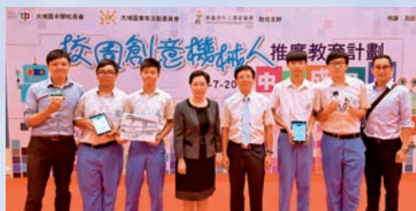
電腦科學生設計「智能小巴系統」 獲校園創意機械人計劃「最佳闡釋獎」