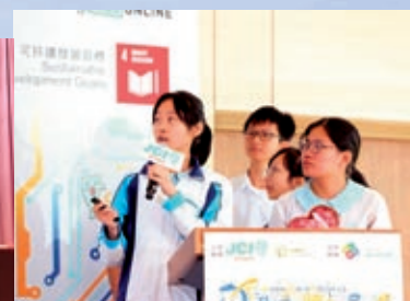
商科學生參加「飛龍騰達」比賽 2018獲得優異獎