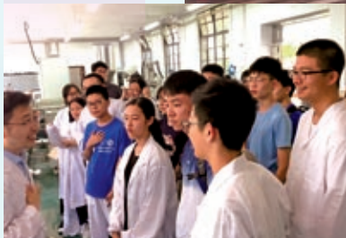
華南理工大學化學系教授親自講解實驗（高校科學營2018）