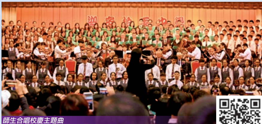
師生合唱校慶主題曲

歌詠團獻唱「良師頌」，感謝眾老師多年來循循善誘，悉心教導，場面感人。結束時，全體老師及歌詠團獻唱校慶主題曲