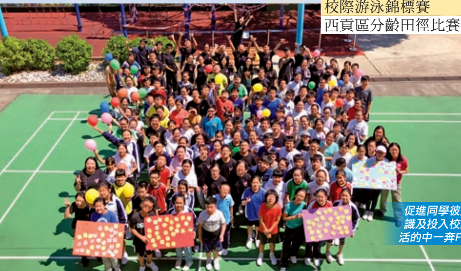
促進同學彼此認識及投入校園生活的一奔Fun營