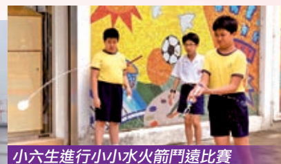
小六生進行小小水火箭門遠比賽