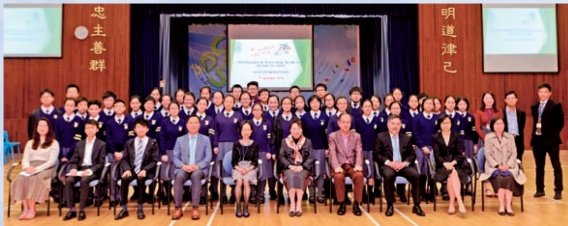
律政司司長鄭若驊資深大律師到訪

律政司司長鄭若驊資深大律師在西貢區議會主席吳仕福太平紳士和西貢民政事務專員趙燕驊太平紳士的陪同下，於十二月七日下午到訪本校。本校學生長團隊與嘉賓分享過去兩年在「模擬法庭·公義教育計劃」學習到的知識，包括法治精神及公義的概念，並演繹「非法禁錮」案件的實際法庭審訊程序。在活動中，鄭若驊司長回答同學的提問，分享她的人生經歷，鼓勵他們繼續積極參與各類活動，訓練思考及提升溝通能力。