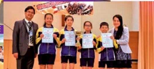
同學們於觀塘區聯校水火箭比賽中屢獲佳績