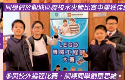
參與校外編程比賽，訓練同學創意思維。